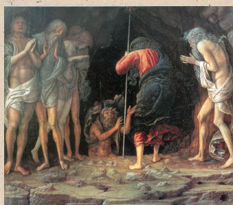
Andrea Mantegna, Zstąpienie Chrystusa do Otchłani

„Jezus nie zstąpił do piekieł, by wyzwolić potępionych, ani żeby zniszczyć piekło potępionych, ale by wyzwolić sprawiedliwych, którzy Go poprzedzili” (KKK 633).