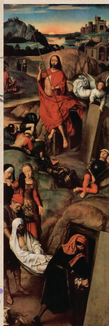
Hans Memling, Zmartwychwstanie (fragment tryptyku Pasja)

W pierwszy dzień tygodnia poszły skoro świt do grobu, niosąc przygotowane wonności. Kamień zastały odsunięty od grobu. A skoro weszły, nie znalazły ciała Pana Jezusa. Gdy wobec tego były bezradne, nagle stanęło przed nimi dwóch mężczyzn w błyszczących szatach. Przestraszone, pochyliły twarze ku ziemi, lecz tamci rzekli do nich: «Dlaczego szukacie żyjącego wśród umarłych? Nie ma Go tutaj; zmartwychwstał. Przypomnijcie sobie, jak wam mówił, będąc jeszcze w Galilei: „Syn Człowieczy musi być wydany w ręce grzeszników i ukrzyżowany, lecz trzeciego dnia zmartwychwstanie”». Wtedy przypomniły sobie Jego słowa, wróciwszy od grobu, oznajmiły to wszystkim. Jedenastu i wszystkim pozostałym... Łk 24, 1-9