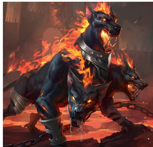
Cerber-pies pilnujący wejścia do podziemia.