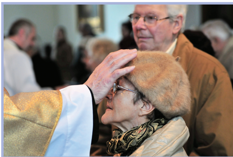
Sakrament namaszczenia chorych