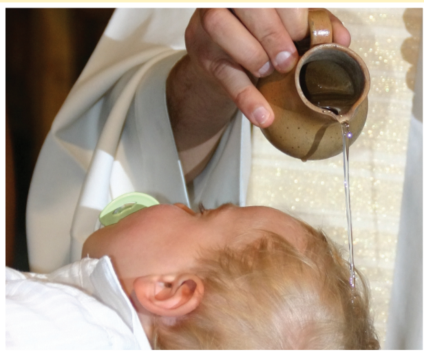
Sakrament chrztu świętego

Sakramenty święte są darami Pana Jezusa. Poprzez nie Chrystus okazuje swoją miłość w różnych momentach życia człowieka.