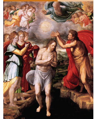
Juan Fernández de Navarrete, Chrzest Chrystusa