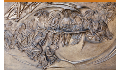
Ostatnia Wieczerza, bazylika Matki Bożej Większej, Rzym